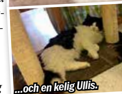
...och en kelig Ullis.