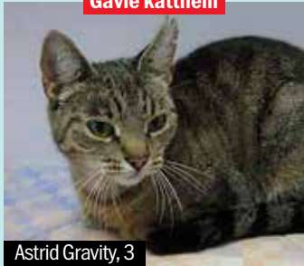
Astrid Gravity, 3

Astrid Gravity är enormt snäll och älskar att mysa och att prata. Hon behöver kunna få gå ut lite då och då.