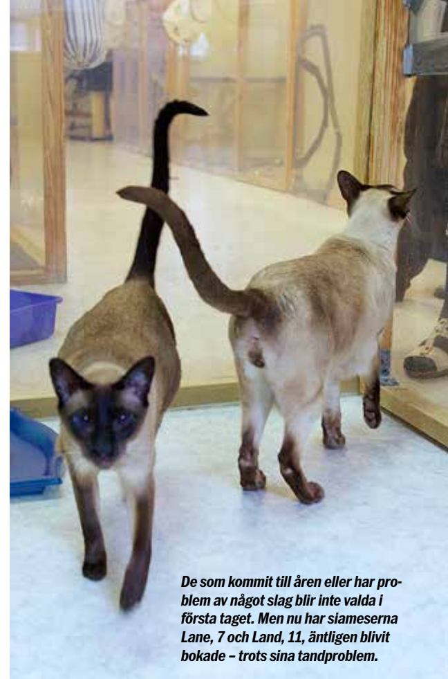
De som kommit till åren eller har problem av något slag blir inte valda i första taget. Men nu har siameserna Lane, 7 och Land, 11, äntligen blivit bokade – trots sina tandproblem.

V i står utanför en rätt sliten barack i Västberga, strax söder om Stockholm.